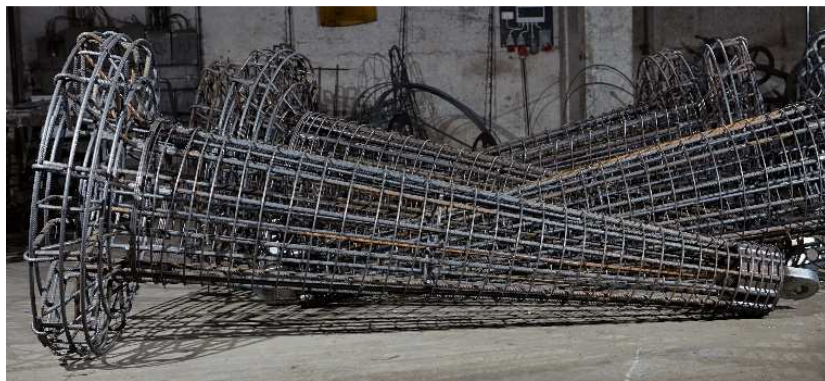
Rys. 1. Prefabrykowane żelbetowe stopy fundamentowe słupów linii WN